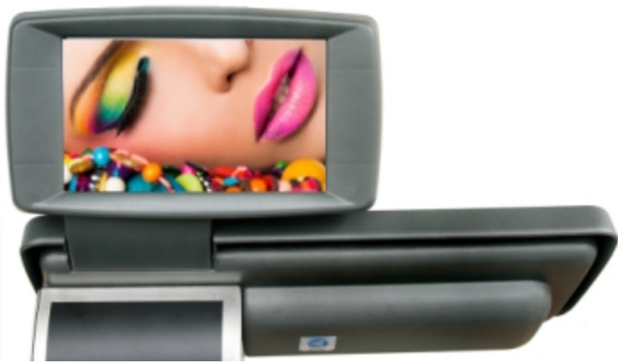
Display lato cliente ad elevate prestazione